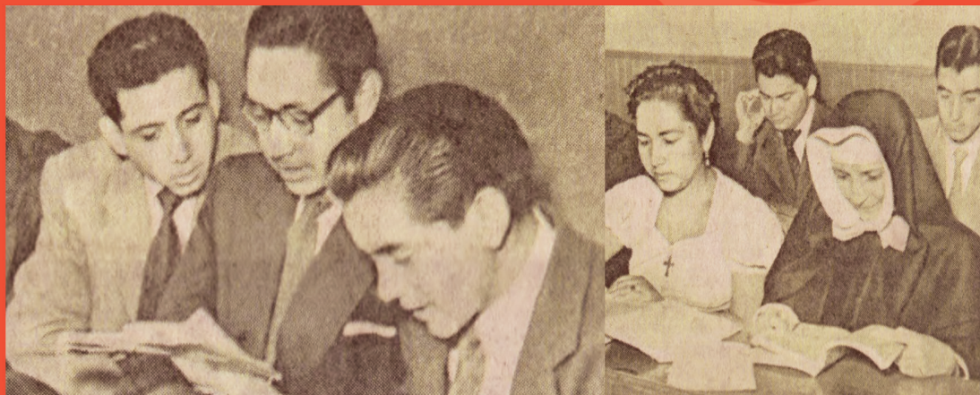
Los años del Bachillerato en la primera mitad del siglo XX