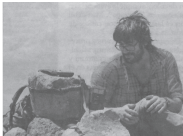
Instalación de cámaras trampa en la pre cordillera de Cacha-pool, en el marco del proyecto liderado por el biólogo Eduardo Pavez.

Los pumas de la zona central al llegar a adulto alcanzan hasta 1,63 metros desde la cabeza hasta la cola, en el caso de las hembras, y 1,80 los machos. Son tallas menores comparadas con las de sus parientes patagónicos, que pueden superar los 2 metros y pesar hasta 90 kilos.