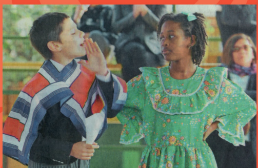
Es urgente la formación de profesores interculturales