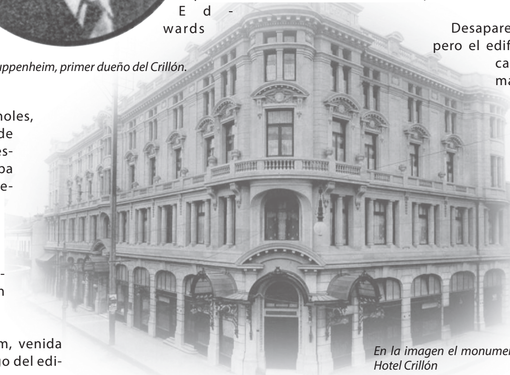
En la imagen el monumental edificio del Hotel Crillón

Desapareció el hotel, pero el edificio y la marca siguen en manos de la familia Cousiño, que remodeló el inmueble, construyó una galería y hoy alberga allí una casa comercial.