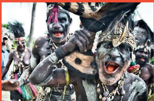
Tribu que comía cerebros humanos ayudaría a entender mejor alzhéimer y párkinson