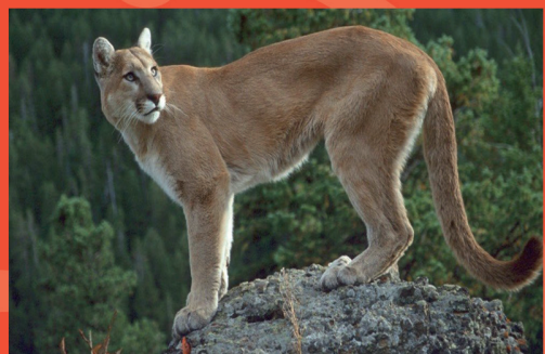
El puma, un depredador para el equilibrio biológico