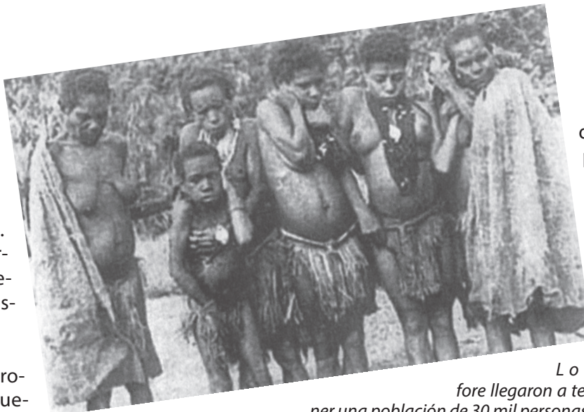
Los fore llegaron a tener una población de 30 mil personas. Más de 3 mil murieron de kuru, la mayoría en la década de 1960. Por cada hombre había ocho mujeres afectadas.

En un estudio publicado en octubre de 2019 en la revista Nature , investigadores ingleses y papú neoguineanos anunciaron el hallazgo en estas personas de una variante de prion que —gracias a una sola e ínfima variación—, en vez de volverse patológico e infectar, se convierte en una barrera que otorga a su portador protec-