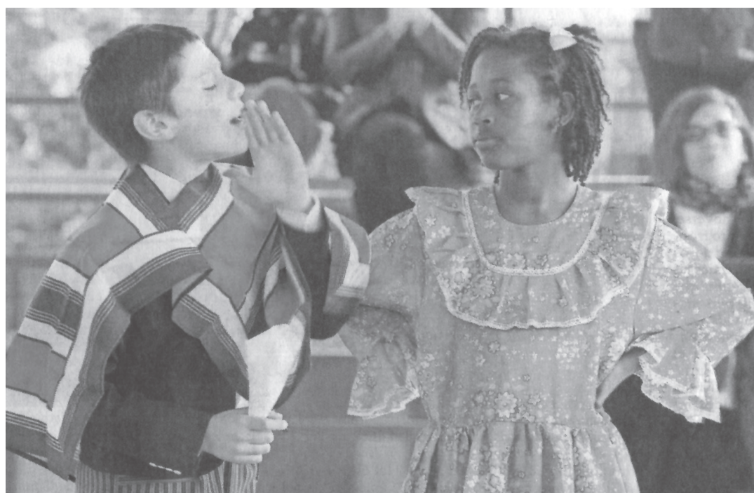
La comunidad de la Escuela Camilo Morí de Independencia —donde de un total de 200 estudiantes, 137 son extranjeros— celebró Fiestas Patrias 2019 en el establecimiento. Nadie quedó fuera: además del 31,5% de alumnos chilenos, en la fiesta participaron niñas haitianas vestidas de huasas, peruanos con trajes pascuenses y colombianos usando el tradicional gorro chilote.

“El sistema chileno no ha pasado por una autocrítica profunda. En comparación con países como Alemania, que después de la Segunda Guerra Mundial se vio obligada a revisar su mirada sobre las demás naciones, pueblos y etnias, aquí nunca se ha revisado el propio racismo. Entonces, más allá de casos particulares, no hay formación antirracista generalizada”.