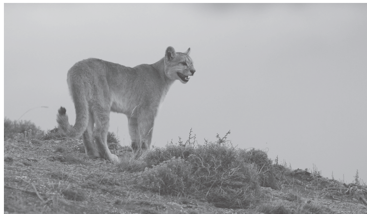
Un puma hembra pudo ser monitoreado durante dos meses gracias al collar satelital que le fue instalado. Hoy se le perdió el rastro, y no se sabe si fue cazado por los arrieros, o simplemente se perdió la señal.