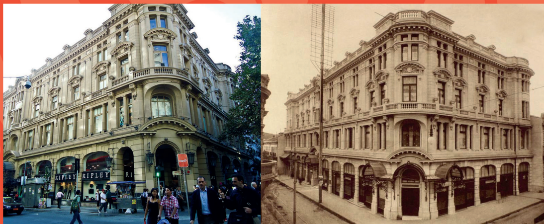
Crillon: El primer gran hotel de Santiago