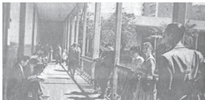
En uno de los pasillos del Instituto Nacional, los alumnos esperan nerviosos la hora del examen, enero de 1957.

cionar a los postulantes", informaba el diario "La Nación" el 16 de septiembre de 1966. De ahí que surgiera la Prueba de Aptitud Académica, que se rindió por primera vez en enero de 1967 y por última vez en diciembre de 2001. Al año siguiente fue sustituida por las Pruebas de Selección Universitaria (PSU).