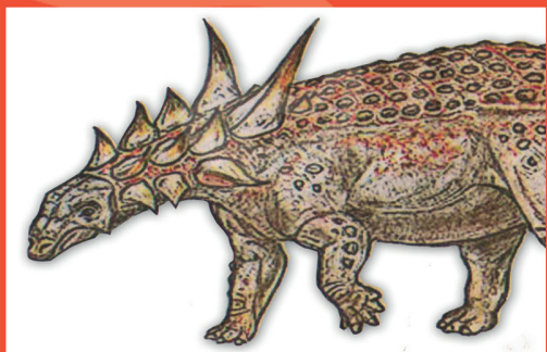
Paleontólogos de E.E.U.U. "a la caza" de dinosaurios en la Antártica

San Felipe - Los Andes - Catemu - Llay-Llay - Panquehue - Putaendo - Rinconada - Calle Larga - San Esteban - Santa María