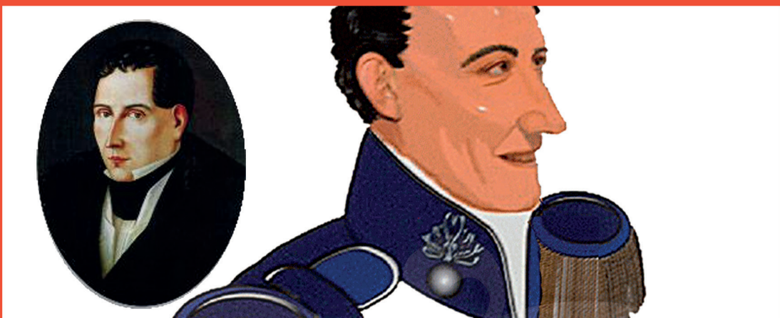
La foto más actual de Diego Portales